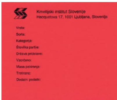
Slika: certificirano seme II. generacije