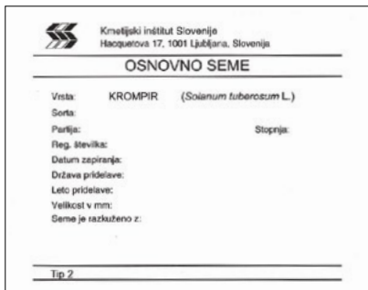
Slika: osnovno seme

je vrstno pristno seme nekaterih poljščin (npr. ajda, proso, panonska grašica, navadna turška detelja), pri katerih sorte še niso bile vzgojene ali požlahtnjene ali pa je teh sort malo.